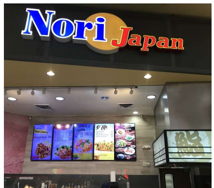
↑現地にある日本食料理店